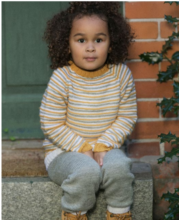
Linus genser & bukse i maisgul, se oppskrift MG 03-07

Strikk til arbeidet måler 20 (21) 22 cm (målt fra midt på vrangborden foran). På neste omgang økes det 1 m på hver side av merket foran og bak (= 4 m økt).