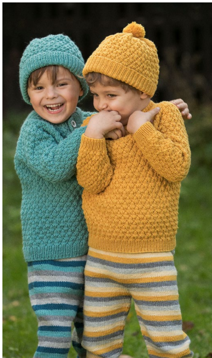
Nordlys jakke, bukse & lue i lys sjøgrønn, se oppskrift MG 03-06